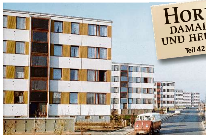
Blick auf die vor 60 Jahren in Montagebauweise errichteten Häuser an der Speckenreye

Als vor 60 JAHREN die ersten Mieter an der Speckenreye Quartier bezogen