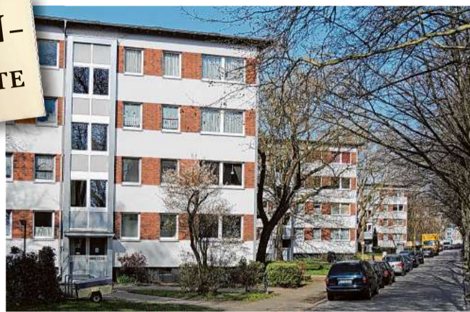
Obwohl zwischenzeitlich energetisch saniert, stehen alle Häuser unter Denkmalschutz!

entstand wahrscheinlich zwischen dem kältesten Abschnitt der Weichseleiszeit vor etwa 22.000 bis 18.000 Jahren und dem Ende der Vergletscherung Norddeutschlands vor etwa 14.500 Jahren. Im Sprachgebrauch der Horner Bevölkerung bezeichnet der Begriff „Geest“ allerdings heute das Nachkriegs-Neubaugelände zwischen den Straßen Kroogblöcke und dem Schiffbeker Weg. Diese Fläche wurde im dörflichen Horn landwirtschaftlich genutzt. Mit Rückgang der bäuerlichen Betriebe und dem Aufkommen der Schreiberbewegung in den 1930er-Jahren, entstanden auf der gesamten Fläche Kleingärten, die nach dem Zweiten Weltkrieg vielfach zu Behelfsheimen umgebaut und erweitert wurden. Ab 1959 begann dann der Wohnungsbau auf dem gesamten Areal, der in drei