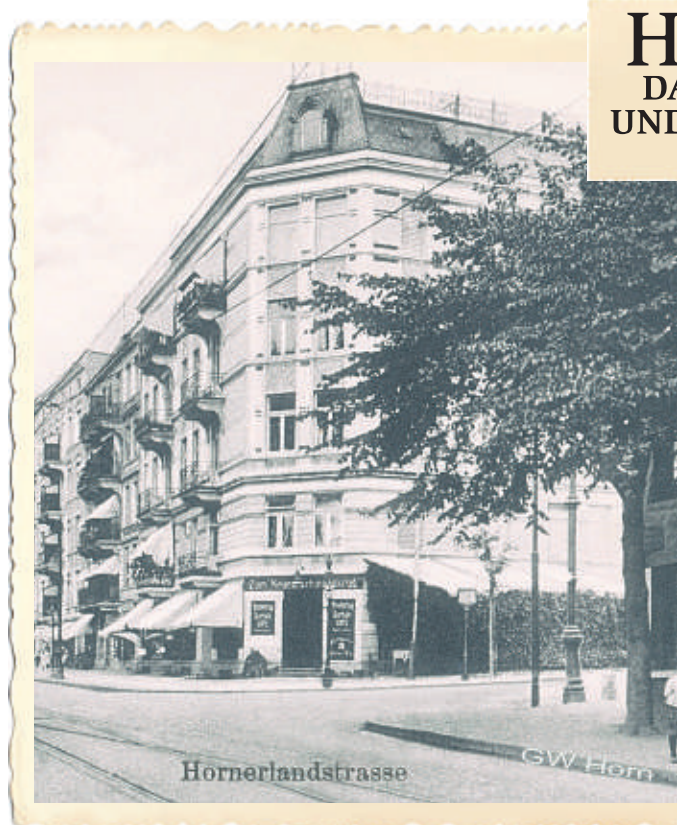
Um 1905 prägte Jugendstil das Bild der Horner Landstraße

Um der stetig wachsenden Einwohnerzahl gerecht zu werden, begann man, meist fünfgeschossige Wohnhäuser – größtenteils in sogenannter Schlitzbauweise – zu errichten. Diese Wohngebäude mit ihrem T-förmigen Grundriss ergaben in der Aneinanderreihung eine friesartige, zur Hofseite mit schmalen Lichtschlitzen versehene Gebäudekette. Dieser Bautyp fand auch an anderen Stellen im aufstrebenden Horn Anwendung, z.B. in der Hertogestraße (zerstört), am Beginn der Horner Landstraße hinter der Brücke der Güterumgehungsbahn (zerstört) und am Ende mit den heutigen Nummern 437/439