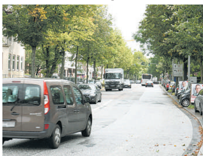
Auf dem Vierländer Damm sollte saniert werden. Nun ist dafür kein Geld mehr da

ROTHENBURGSORT Verschiedene Themen werden in der Bezirksversammlung nicht mehr behandelt, sondern zur Kenntnis genommen und gelten damit als beschlossen. Dazu gehörte auch ein Antrag, nach dem der Vierländer Damms und die Ausschläger Allee saniert werden sollen – und dabei auch einen Radweg erhalten sollen. Die Initiative dazu kam aus dem Stadtteilrat Rothenburgsort. Das Bezirksamt teilte den Abgeordneten nun mit, dass es die „angesprochene Maßnahme“ als Lückenschluss zwischen der umgestalteten Ausschläger Allee und dem Billhorner Röhrendamm sehe. „Aufgrund des Umfangs einer Umgestaltung, den erwarteten Baukosten und dem vordringlichen Veloroutenprogramm, ist eine kurzfristige Planung und Umsetzung leider nicht möglich.“